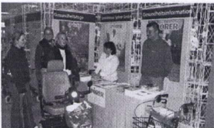
Gesundheitstage im WestPark: Das Sanitätshaus Spörer stellt Produkte aus dem Sanitätshaus und den Reha-Bereich vor.

Stepptanz, 11 Uhr Vortrag über Osteopathie, 11.30 Uhr Tanzvorführung, 12 Uhr Thai Bo, 12.30 Uhr Tanzaufführung, 13 Uhr Videoclip, 13.30 Uhr Spinning.