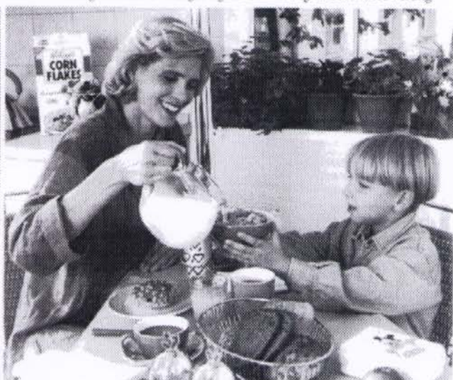
Milch und Milchprodukte sorgen besonders gut für den notwendigen Nachschub an Calcium.

Calcium ist vor allem in Milch und Milchprodukten enthalten, Magnesium in Vollkornprodukten, Nüssen und magerem Fleisch. Doch Vorsicht: Selbst