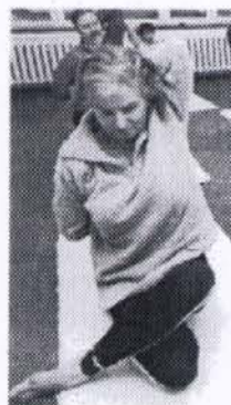
Yogaübungen zeigen die fernöstliche Möglichkeit der völligen geistigen und körperlichen Entspannung.