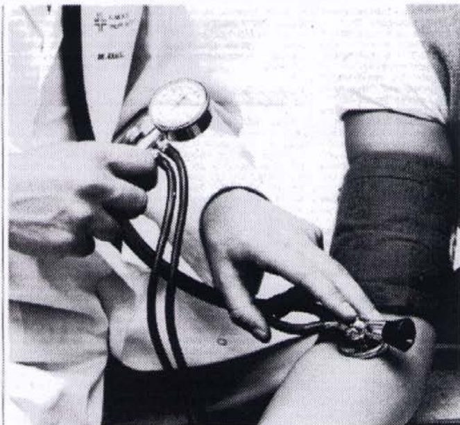
Wie ist es um den Blutdruck bestellt? Eine kurze kostenlose Messung gibt Aufschluss darüber.

Die Besucher können kostenfrei diverse Dienstleistungen, zum Beispiel Blutdruck- und Venenfunktionsmessung, Fuß-