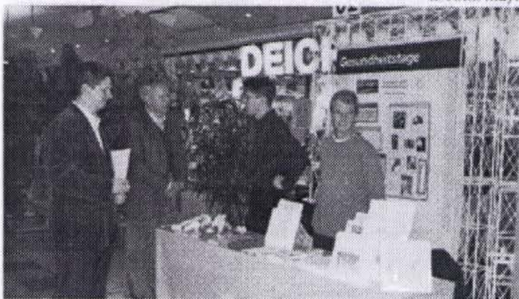
Gesundheitstage im WestPark: Der Krankenhauszweckverband informiert unter dem Motto "In guten Händen".