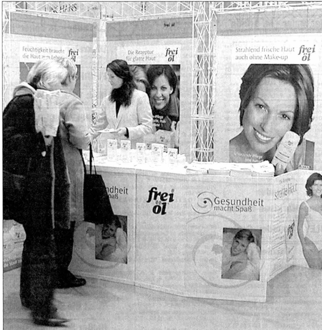
Gesundheitsvorsorge und Pflege kann auch Spaß machen, das will eine Ausstellung im Roland-Center zeigen.