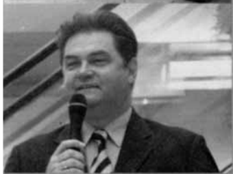
6 OB Herzog eröffnete die Gesundheitstage in der City Galerie

6 Sind die Venen noch in Ordnung? Wie sieht es mit dem Blutdruck aus? Sechs Tage lang ging es in der City Galerie auf den diesjährigen 4. Gesundheitstagen wieder um das Thema Gesundheit. Der diesjährige Schwerpunkt der circa 20 Stationen: Vorsorge und Wellness. Ein scheinbar begehrtes Thema, wie man an dem Andrang testfreudiger Menschen am Eröffnungstag am 12. Februar merken konnte.